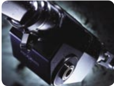
► Elektrisches Reffsystem EF90