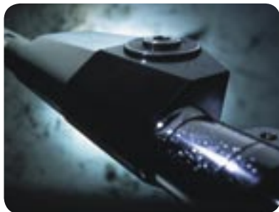
► Hydraulisches Reffsystem RF90