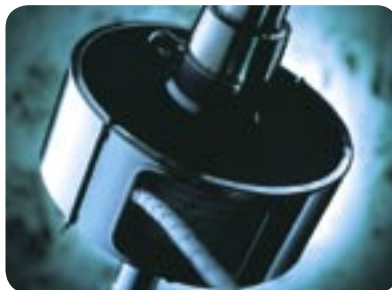
► Reffsystem RS2000

Für Segler, die aufgrund ihrer Regatta-Ambitionen neben ihrer Standardrollreffianlage bisher ein Profilvorstagsystem aus Kunststoff fahren, haben wir die RC Carbon Anlagen entwickelt. Sie sind so konzipiert, dass der lästige Umbau vor jeder Regatta entfällt. Ausgelegt sind die RC Systeme für Schiffe von ca. 42 bis 68 Fuß mit Vorstaglängen bis etwa 30m. Da auf einen Meter des Doppelnut Carbonprofils lediglich 0,327kg (S2) bis 0,77kg (S4) anfallen, baut die gesamte Anlage so leicht, dass sie sogar das Gewicht eines entsprechenden Regatta Profilstagsystems nicht überschreitet. Mit der RC30 und der RC40 haben Sie damit ein sehr leichtes Rollreffsystem für den Cruisingbereich und brauchen kein anderes System mehr für die Regatten.